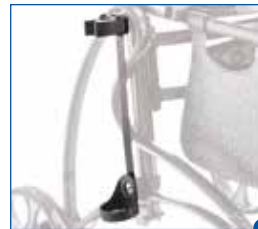
5 Stockhalter für den Gehstock