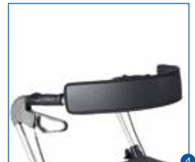
4 Polsterung für den Rückengurt für ein angenehmeres Anlehnen