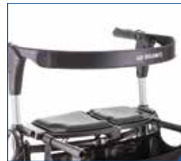
3 Mit dem Rückengurt sitzen Sie sicher auf dem Rollator