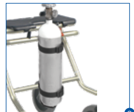
8 Für die Versorgung mit Sauerstoff ist ein Halter für Sauerstoffflaschen verfügbar