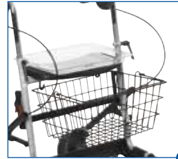
1 Ein passender Korb für die Mitnahme diverser Gegenstände

Entdecken Sie die Besonderheiten unserer Rollatoren – welches Modell Ihnen welche Ausstattung bietet, erfahren Sie in der Tabelle auf der nächsten Seite.