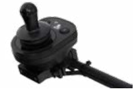
2231 / 2232