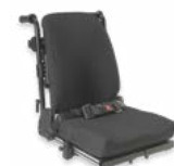
Rücken: ARJ 2174, 2175