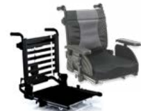
Rücken: ARJ 2171