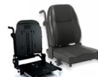
Rücken: ARJ 2172 bzw. 2173