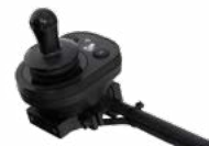
2231 / 2232