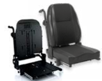
Rücken: ARH 2172 bzw. 2173