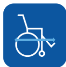
Gesamtlänge inkl. Beinstützen ▼